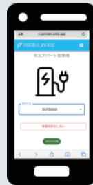
スマホ画面(アプリ)