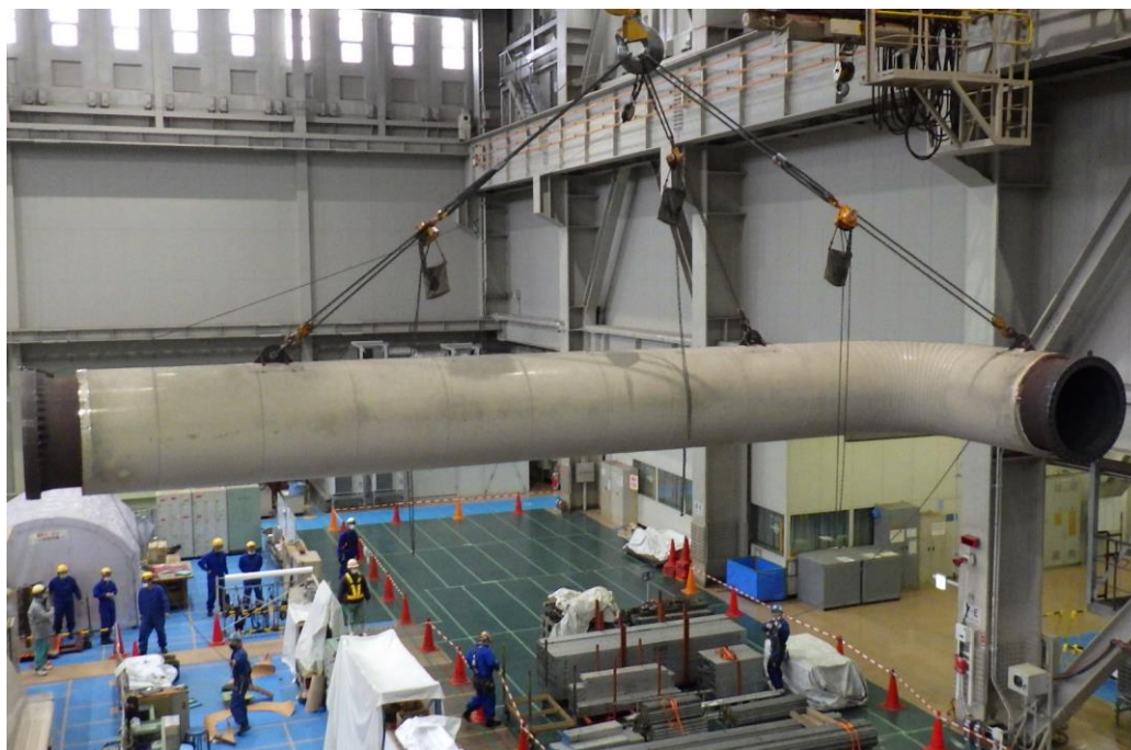
タービン点検（蒸気配管吊上）作業状況（タービン建屋内 2月24日撮影）