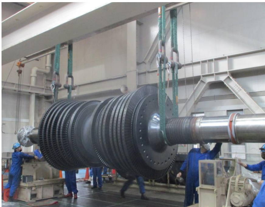
タービン点検（ロータ吊上）作業状況（タービン建屋内 3月4日撮影）