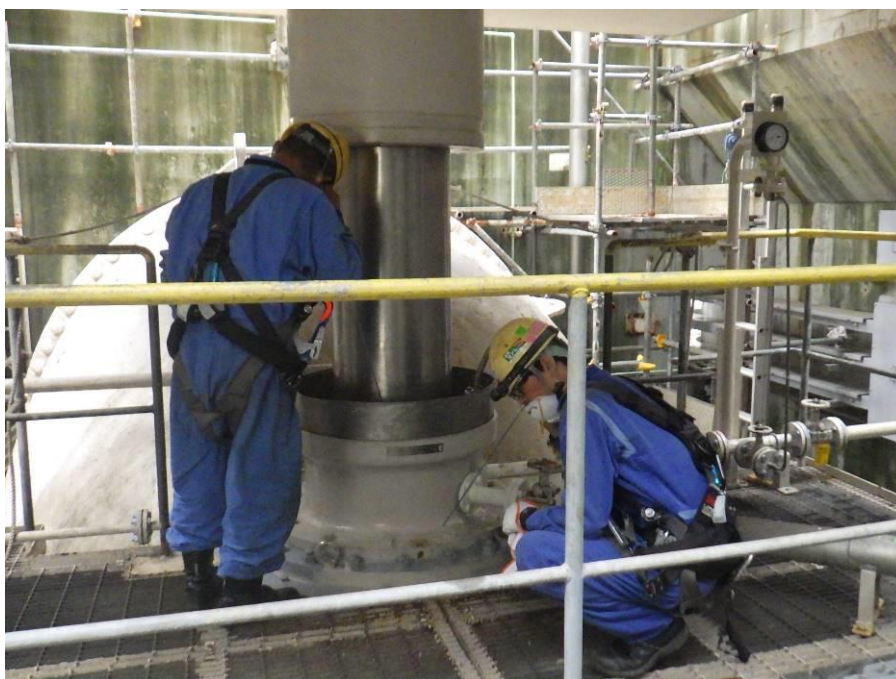
循環水ポンプ点検（試運転）作業状況（屋外 4月26日撮影）