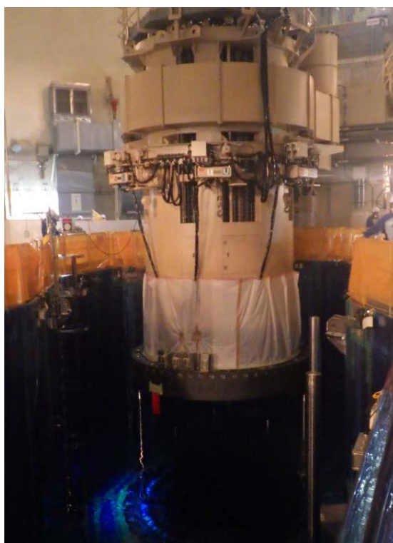
原子炉容器上蓋吊込み作業状況（原子炉格納容器内 12月2日撮影）