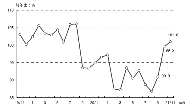
(参考1) 販売電力量の前年比の推移