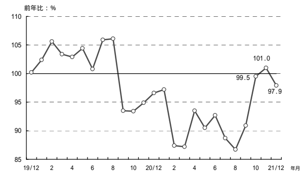
(参考1) 販売電力量の前年比の推移