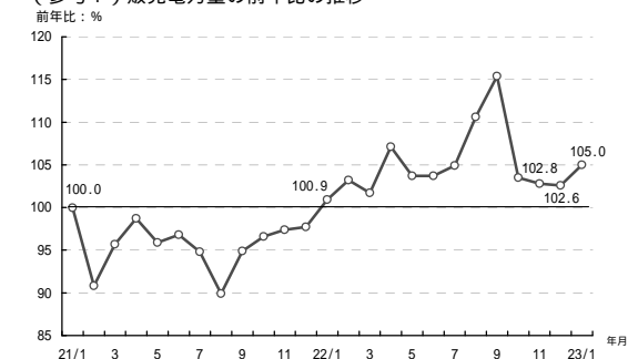
(参考1) 販売電力量の前年比の推移