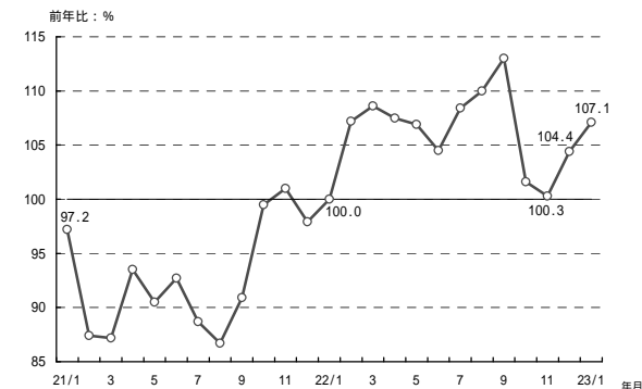
(参考1) 販売電力量の前年比の推移