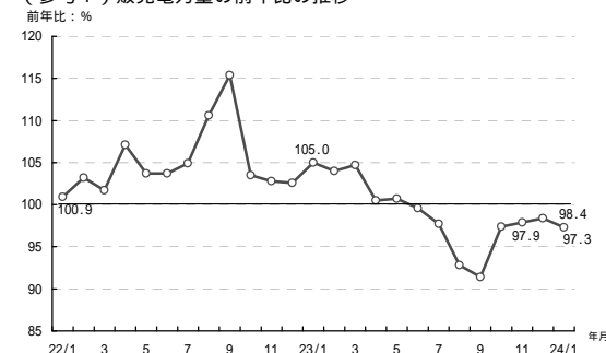
(参考1) 販売電力量の前年比の推移