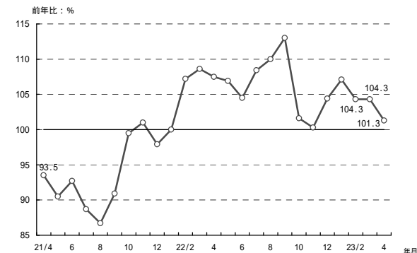
(参考 1) 販売電力量の前年比の推移