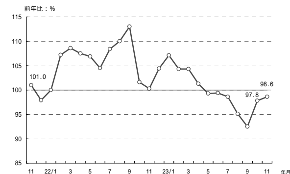
(参考1) 販売電力量の前年比の推移