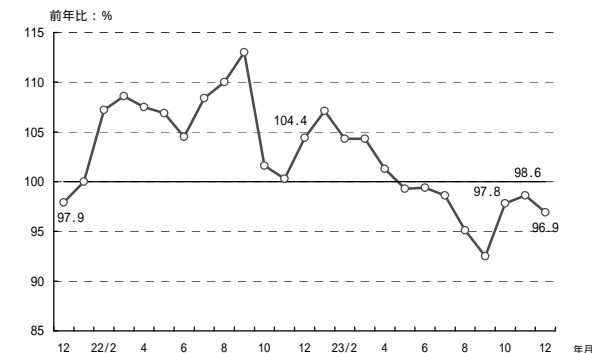
(参考1) 販売電力量の前年比の推移