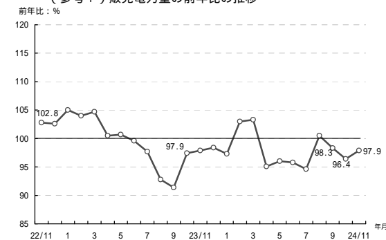
(参考1) 販売電力量の前年比の推移