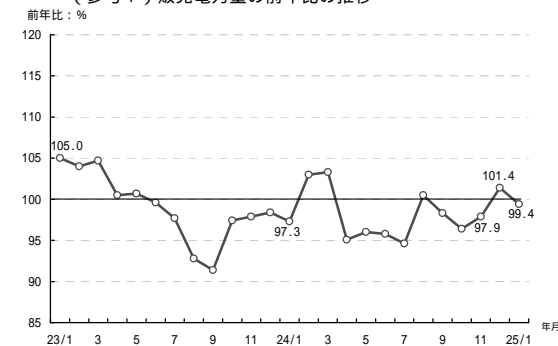
(参考1) 販売電力量の前年比の推移