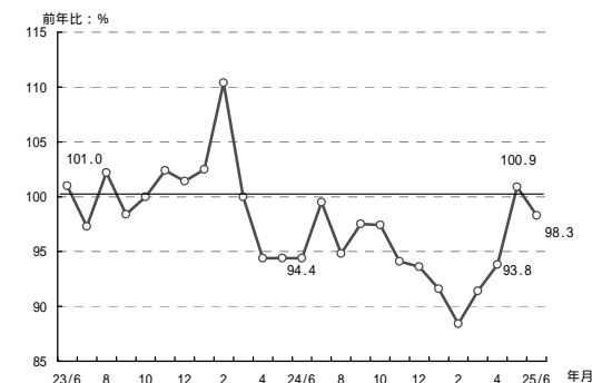
(参考3) 高松市平均気温