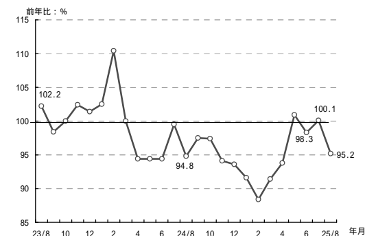
(参考3) 高松市平均気温