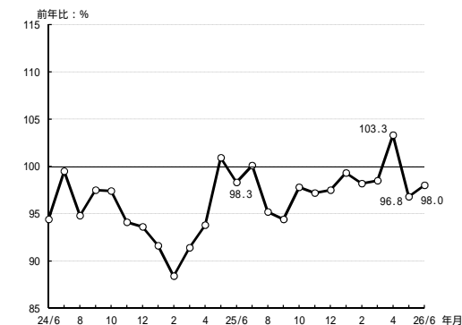
(参考3) 高松市平均気温