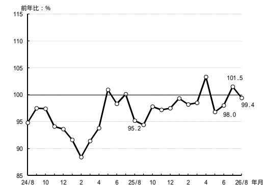
(参考3) 高松市平均気温