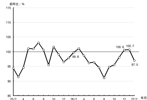
(参考1) 販売電力量の前年比の推移