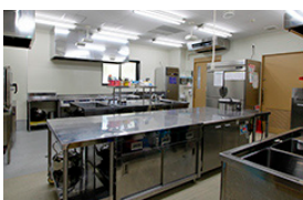
▲コンパクトな電化厨房

〒799-2652 愛媛県松山市福角町甲1285-1 TEL:089-979-5026 FAX:089-979-5027