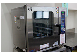
▲スチームコンベクションオープン