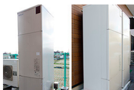
▲業務用エコキュート