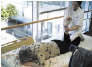
▲身体の癒しサービス