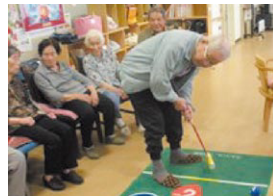
▲介護プラザ「サン愛」