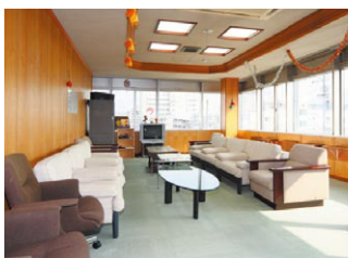
▲石鎚連峰が一望できるカラオケ喫茶