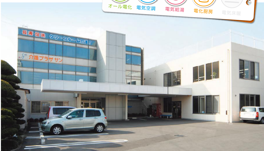
▲さまざまなニーズに応える総合介護施設