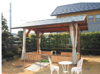
▲季節を感じながら暖まる足湯