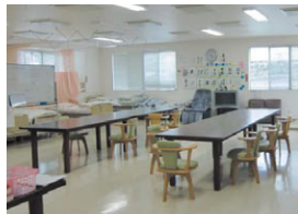
▲デイサービスセンター「デイサン」