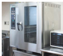
▲スチームコンベクションオーブン