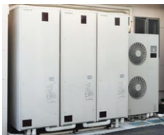
▲業務用エコキュート

誰もが住み慣れた地域や家庭で、健やかに生き生きと暮らせる地域社会の実現の手助けができるよう、これからも活動して行きます。