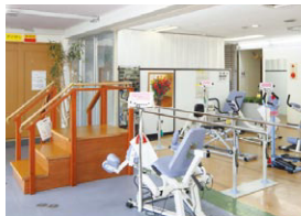
▲デイサービスセンターふじ

私たちは新たな取り組みで、皆さんが笑って暮らせるようさらなる介護サービスの追求をしています。