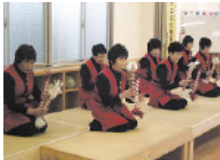
▲ボランティアの楽しいイベント