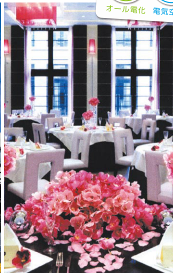
▲二人の個性に合わせた会場演出