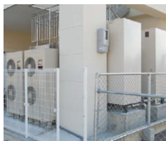
▲業務用エコキュート