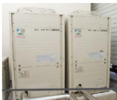
▲パッケージエアコン

特に、電化厨房は、新調理システムの実践には最適で効率よくかつ、グレードの高い料理が提供できます。さらにクリーン・クールな厨房環境は、作業負担を軽減するほか、食材の鮮度・品質管理にも優れていることから衛生的で調理スタッフからも好評です。お客さまに満足いただけるおもてなしと今後の事業拡大にはオール電化は欠かせないと思います。