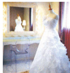
▲花嫁だけのお部屋「マリエ」

また、披露宴のメニューも洋でありがたながら和のテイストにアレンジした斬新な味わい。地元産の旬の素材をふんだんに取り入れたフレンチスタイルはゲストの方にも味と新しさにご満足いただける傑作です。