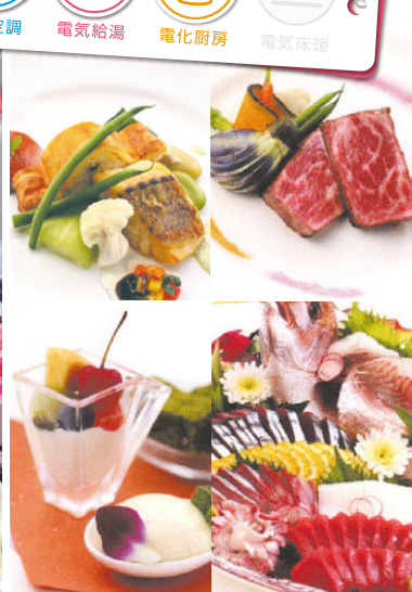
▲料理は人気のフレンチスタイル