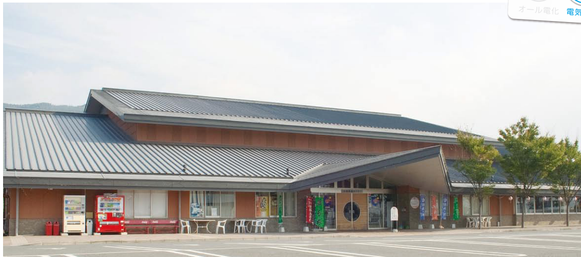
▲阿讃の山々に囲まれた施設