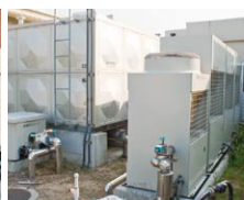
▲業務用エコキュート