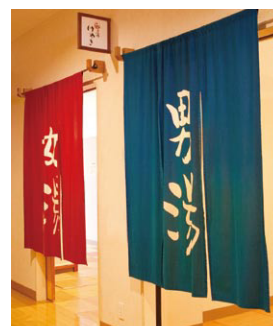
▲日替り楽しめる2つの浴場