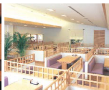
▲和風レストラン 秋月