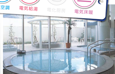
▲明るく広い大浴場ヴィーナス