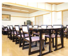
▲床暖房を完備した宴会場

今後は厨房の電化も検討しています。自宅ではIHクッキングヒーターを使っていて機能にも、大変満足しています。調理人の立場からぜひ導入したいですね。