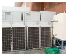
▲ビル用マルチエアコン（蓄熱式）