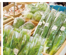
▲地元農家直送の青果