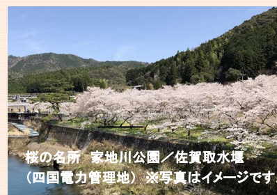
桜の名所 家地川公園／佐賀取水堰 (四国電力管理地) ※写真はイメージです。

春の芽吹きを感じられる予土線沿線を、貸切特別列車でゆっくり まったり走りながら、小さな恋の芽を探しに遊びにきませんか。 予土線が出会い、思い出の場所になるかも！？