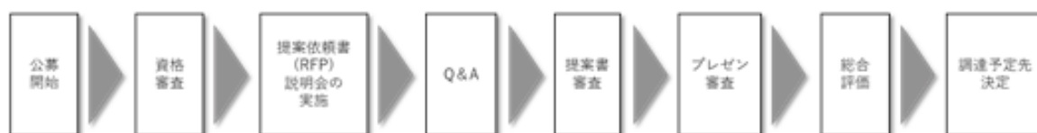
図2 公募開始から調達予定先決定までのフロー

参加者の公募から調達予定先決定までの流れ（フロー）は以下のとおりです。（図2 参照）