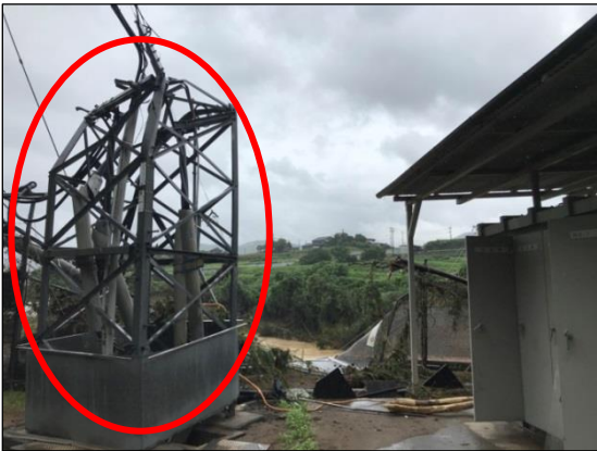
■ 洪水の影響で倒壊した配電線引出鉄構