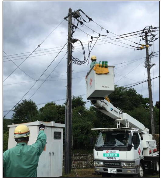
■ 電線のチェックをしながらの復旧作業