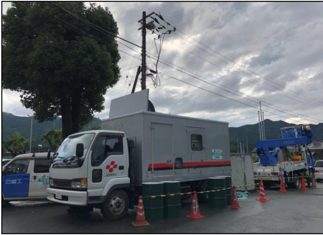
■ 発電機車を使つての応急送電