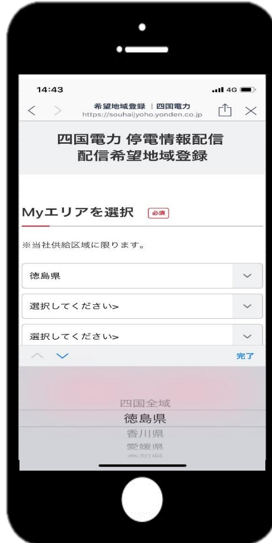
②四国全域または県を選択