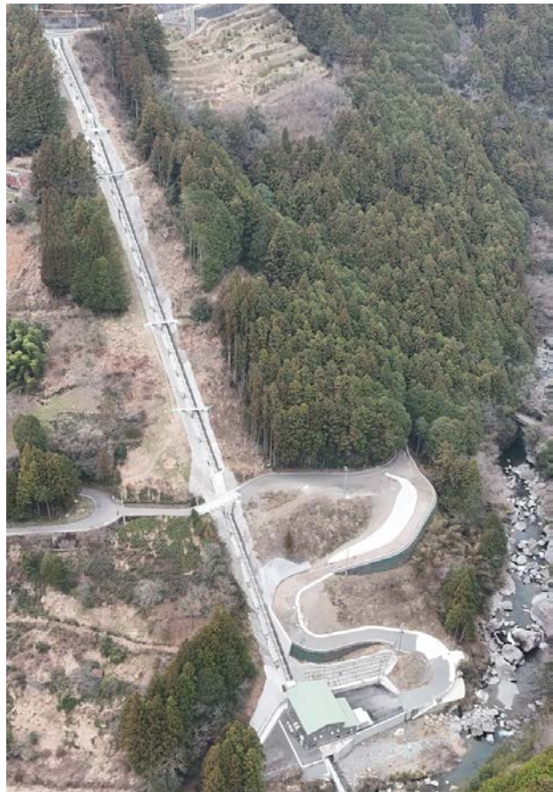
<水圧管路・発電所 全景>