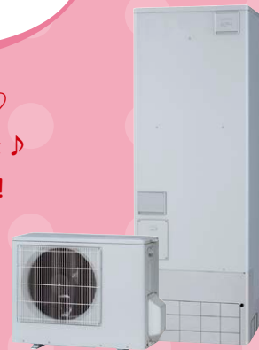
※写真・イラストはイメージです。